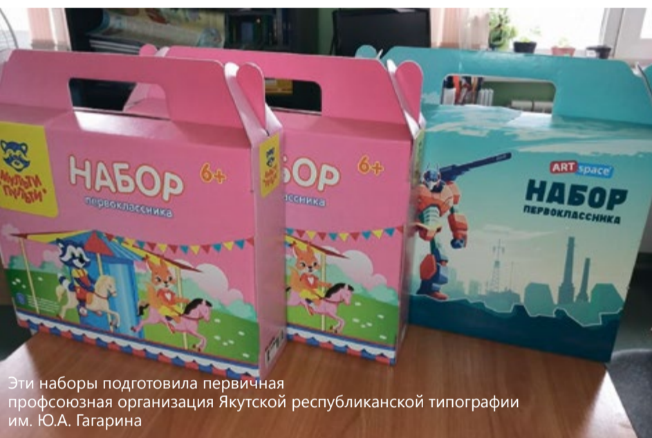
Эти наборы подготовила первичная профсоюзная организация Якутской республиканской типографии им. Ю.А. Гагарина