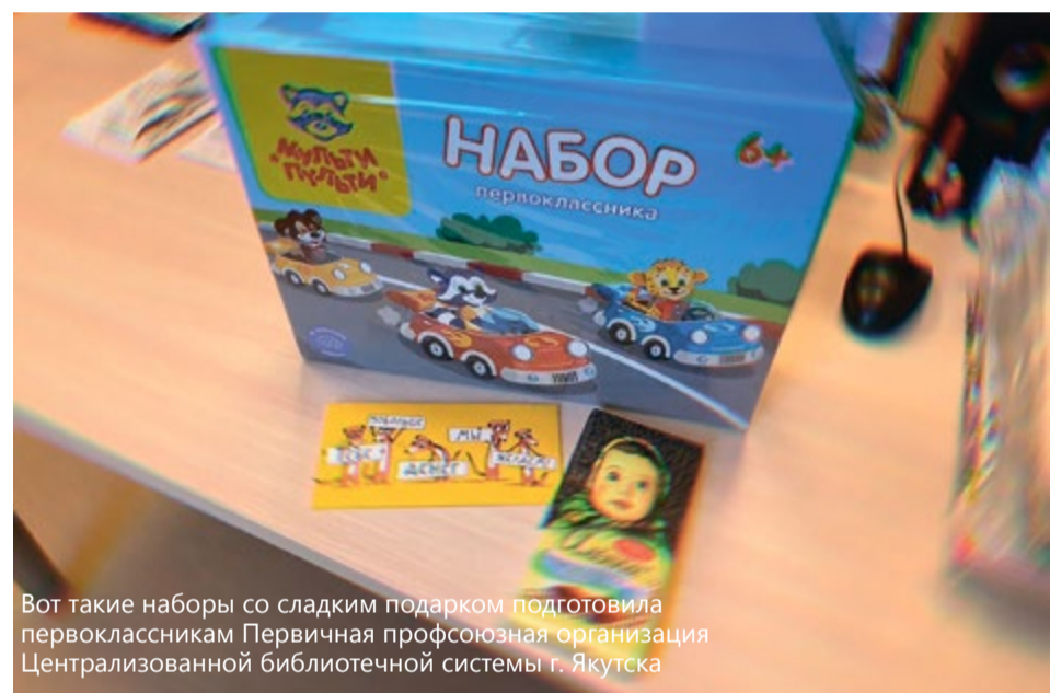
Вот такие наборы со сладким подарком подготовила первоклассникам Первичная профсоюзная организация Централизованной библиотечной системы г. Якутска